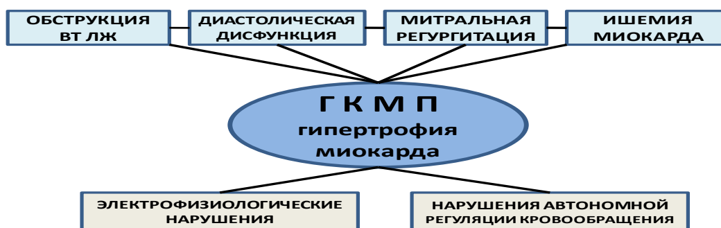
Рисунок 1. Основные патогенетические факторы развития ГКМП